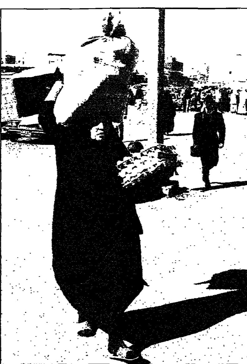
سيدة تحمل أغذية اشترتها من سوق بغداد حيث وصلت أول شحنة من المواد الغذائية

مع العراق اتفاقاً لتأمين المرحلة الثانية لحفل غربي بقيمة 3.5 مليارات دولار منحة 23 عاماً بعد المبادرة بالإنتاج. كما التقت مع العراق على تأسيس شركة مشتركة لطحن الألبان الغذائية والتعاون الطبي والنفسي. وحقق الصحافي «القاسمي» من نائب وزير الخارجية الروسي فيكتور يوسوفالوف الذي شارك في وفد روسي زار العراق في الأسبوع الماضي قوله إن الوفد كان كامل الطموح الذي تفرغها مجلس الأمن في العراق منذ إنجاح لواءه الكويتي في آب (أغسطس) 1990. وأكد يوسوفالوف أن «الجنة الصحية ستستعد بؤام نهاية الحصار على العراق بعد أن أوفى بعض التزاماته تجاه قرارات الأمم المتحدة».